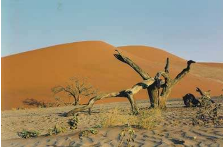
Deserto del Namib

Un pezzo d'Africa dal fascino tutto particolare, un crogiuolo di razze, culture, tradizioni: sudafricani, tedeschi, boschimaniani, Herero, Himba ed altre tribù. Grandi sconfinaste distese caratterizzano il paese, la savana, che la luce trasforma in un mare di colori, la costa, il deserto sono spettacoli naturali di sensazionale bellezza.